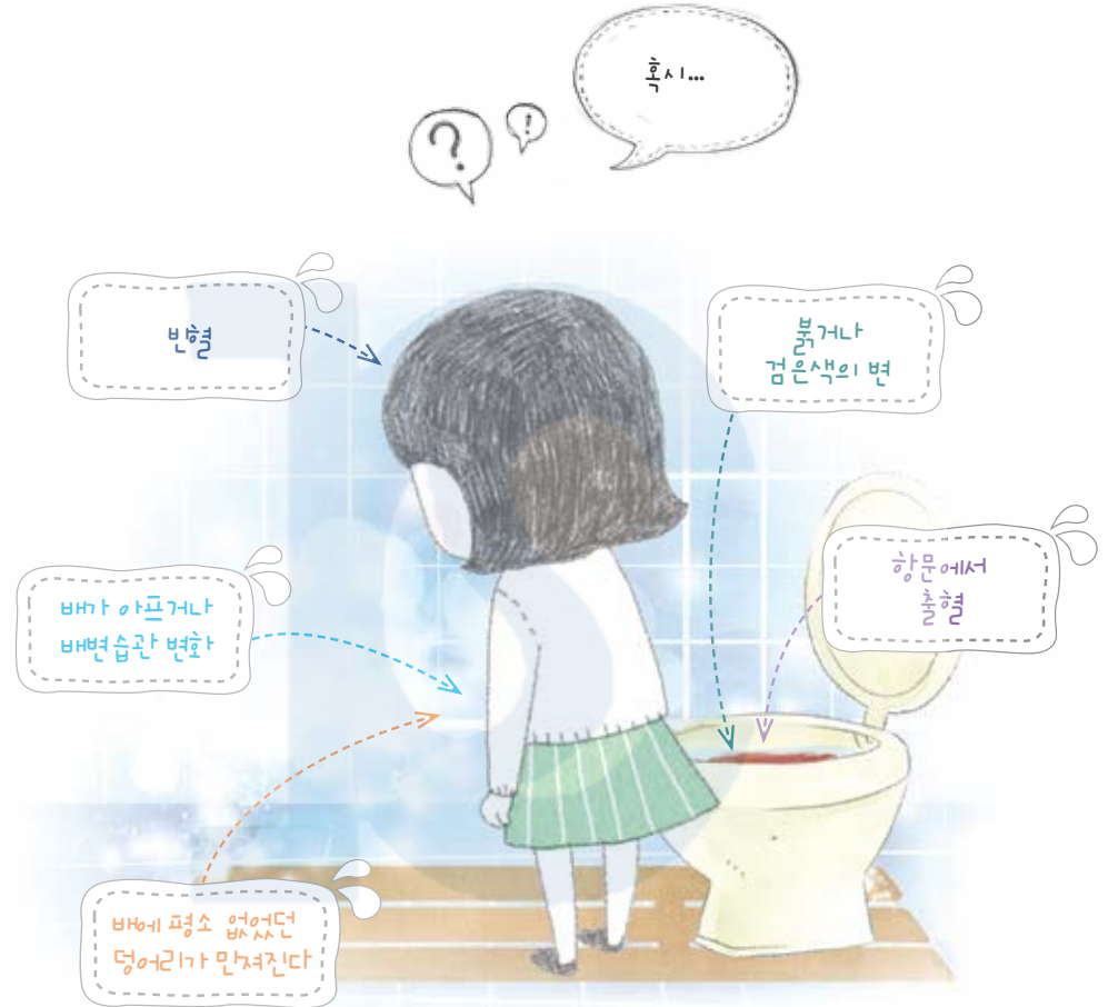
[그림 5] 대장암의 증상